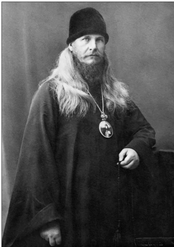
Архиепископ Воронежский Петр. 1926 год

признают, дела с ним не имели и не желают иметь. Они, как представители рабоче-крестьянской власти, считаются только с волей рабочих и представителей верующих.