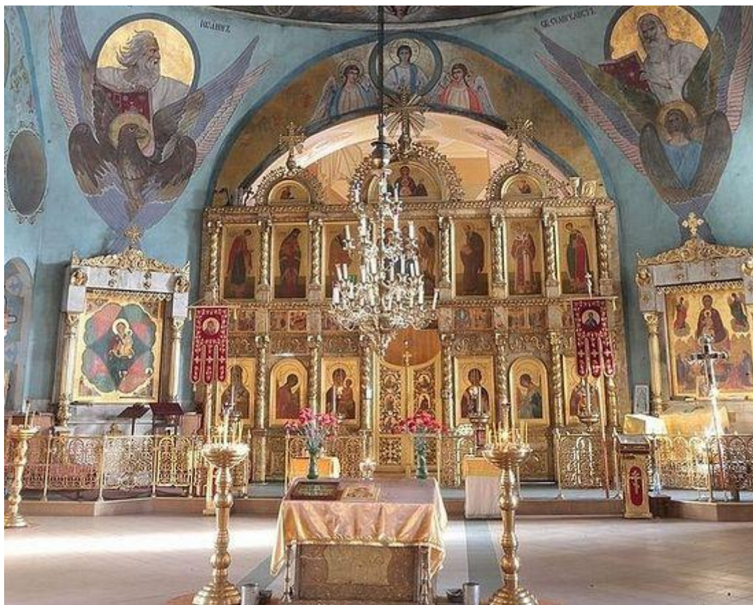
Иконостас Свято-Никольского храма в Ракитном.