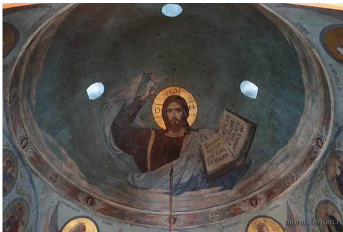
Спас Вседержитель. Фреска под куполом храма в Ракитном, выполненная арх. Зином (Теодором).

Всей душой отец Серафим избегал греха осуждения и старался оградить от него своих духовных чад. Когда ему начинали рассказывать о нанесенном