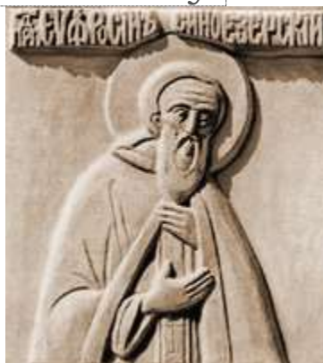
Прмч. Евфросин Синозерский. Фрагмент рельефа

украшенны» (Яковцевский Г., свящ. Ист. сведения о Синозерской пуст., Устюженского у., Новгородской губ., и ее основателе св. прмч. Евфросине, Новгородском чудотворце. Новгород, 1912. С. 17). В иконописных подлинниках XVIII-XIX вв. под 26 и 28 янв. облик Е. (форма бороды) уподобляется, как правило, ап. Иоанну Богослову: «Сед, брада Богослова» (ИРЛИ (ПД). Перетц. № 524. Л. 116 об., 30-е гг. XIX в.); «[Брада] Иоанна Богослова. Синозерскаго чудотворца и Устюжны Желез[нопольской]» (БАН. Строг. № 66. Л. 76 об., кон. XVIII в.). Встречаются и др. варианты: «Рус, брада подоле Козмины, в схиме, ризы преподобническа» (РНБ. Погод. № 1931. Л. 103, 20-е гг. XIX в.). В рукописи XVIII в., принадлежавшей Г. Д. Филимонову , святой упоминается как «священноначальник обители Троицы Иоанна Богослова Синозерскаго» (Филимонов. Иконописный подлинник. С. 44), что связывает особенности его иконографии с посвящением одного из храмов Синозерской пуст. ап. Иоанну.