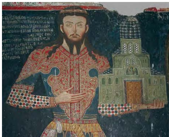
Деспот Јован Оливер у ктиторској композицији.