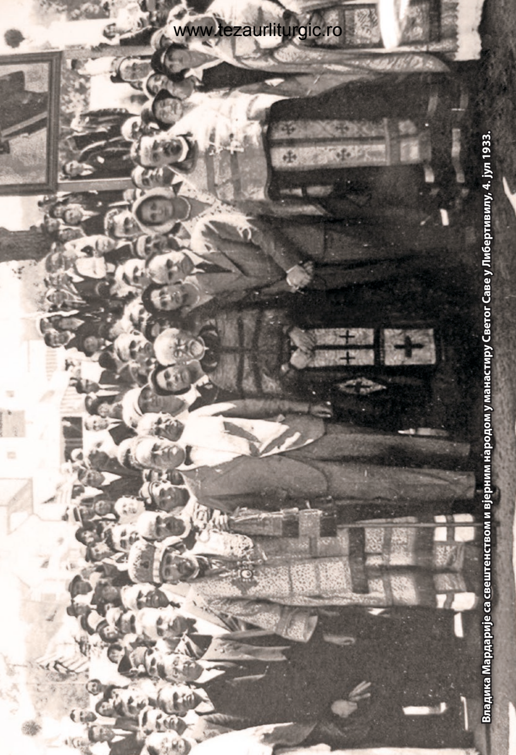
Владика Мардарије са свештенством и вјерним народом у манастиру Светог Саве у Либертивилу, 4. јул 1933.