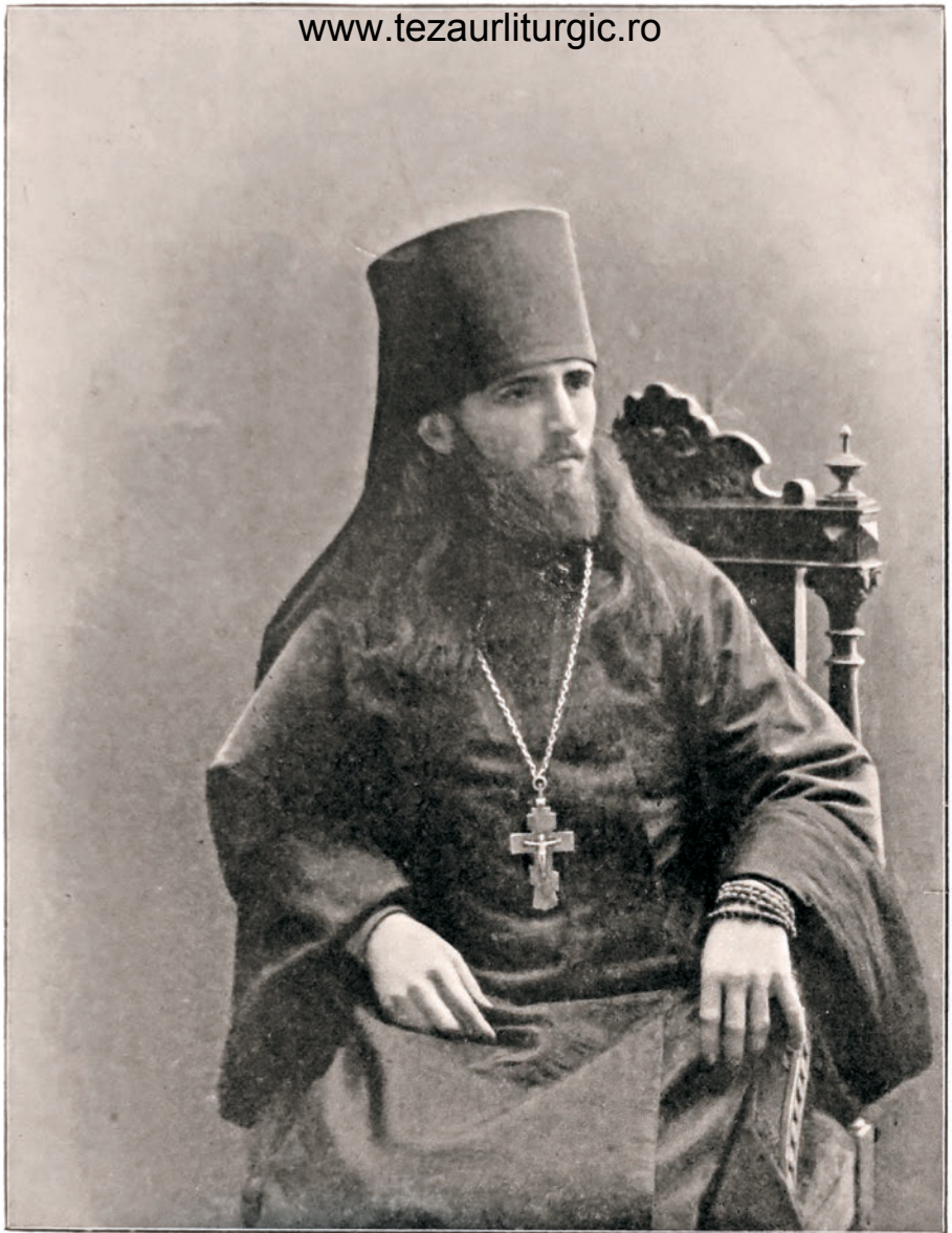
Иеромонахъ Мардарійъ Ускововичъ.