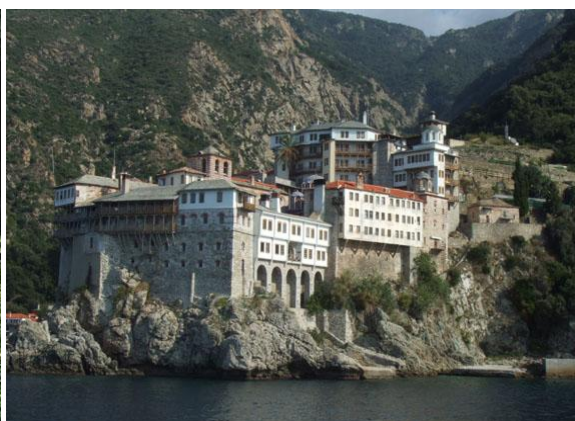
Манастир Григоријат – на Светој гори Атонској.