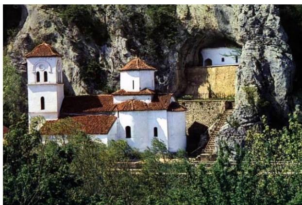
Манастир Горњак – у Браничеву, Србија.

На ову молбу манастира Григоријата одговорио је епископ Браничевски и манастир Горњак тако што је део светих моштију светог Григорија из Горњака доставио манастиру Хиландару, са молбом да их о празнику Ваведења (ове 1977. године) преда свечано братији Григоријатској, која дође на празник у Хиландар, што је заиста тако и учињено. Иначе, манастир Григоријат слави блажени спомен преподобног Григорија 7. децембра (сутрадан по светом Николи), а то је и дан упокојења преподобнога који се слави у манастиру Горњаку, и под којим се спомиње у старим Пролозима и Синаксарима. Још и по иконама преподобног Григорија, које се налазе у манастиру Григоријату и у манастиру Горњаку, види се да је то један и исти светитељ. Његовим светим молитвама нека Господ и нас помилује и спасе. Амин.