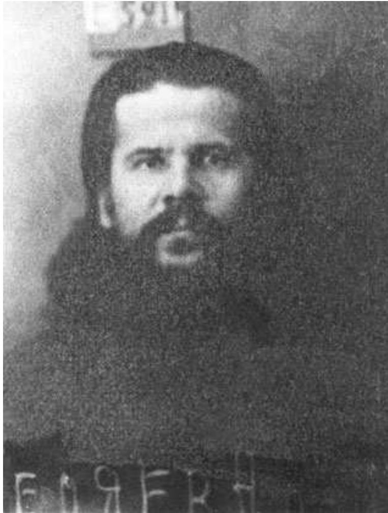
Епископ Августин. Москва. Бутырская тюрьма. 1926 год

полная, об этом свидетельствует факт отстранения от должности уездного уполномоченного. Что мои действия имели всегда свою целью сохранить добрые отношения с местной властью и ликвидировать возникающие конфликты, об этом может свидетельствовать губернский уполномоченный Иваново-Вознесенского ОГПУ... с которым в крайнем случае, если бы он стал отказываться от подобного засвидетельствования, я хотел бы иметь очную ставку».