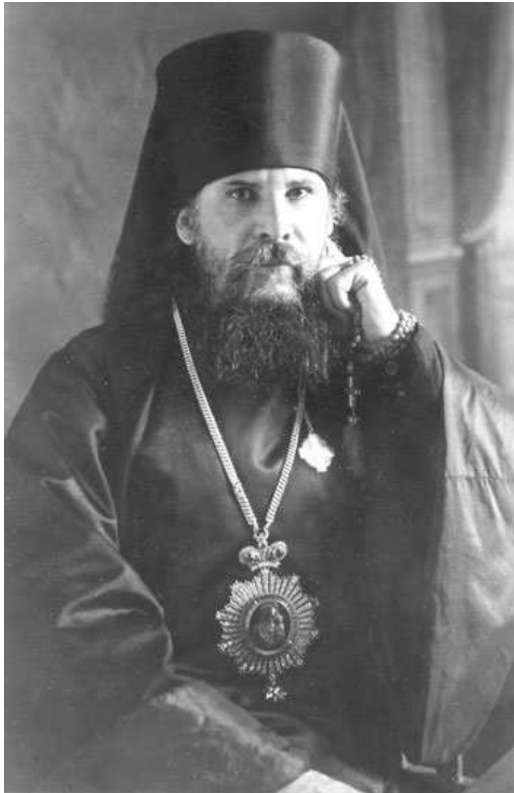
Епископ Сызранский Августин

который является соборным старостой... но не отрицаю, что духовенство, в лице отдельных лиц, по делам богослужебного характера у меня на квартире бывало, а также бывали на квартире и представители церковных обществ, которые являлись для приглашения меня на богослужения. В пунктах предъявленного мне обвинения в систематической агитации и распространении провокационных слухов, а также психологической подготовке массы к предстоящей интервенции, в умышленной концентрации всего реакционного духовенства и торгового, монашеского элемента вокруг Казанского собора виновным себя также не признаю...»