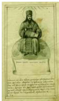
Свт. Димитрий Ростовский. Миниатюра из

Важное место в лит. наследии Д. ростовского периода занимает «Келейный летописец», широко распространенный в списках и многократно издававшийся (Летопись... сказующая вкратце деяния от начала миробытия до Рождества Христова... с присовокуплением Келейной летописи. М., 1784; посл. изд.: Келейный летописец свт. Димитрия Ростовского с прибавлением его Жития, чудес, избранных творений и Киевского Синописа архим. Иннокентия Гизеля. М., 2000). Существуют авторизованные, с правкой Д., списки: ГИМ. Син. № 53; РНБ. Тит. № 957; НБУВ ИР. № 346 П/163; ДА П/162.