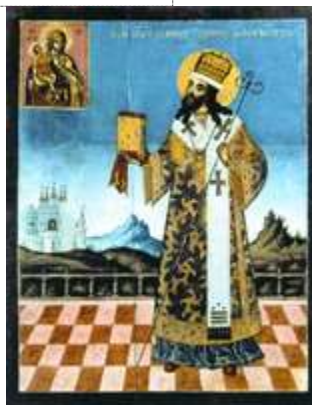
Свт. Димитрий Ростовский. Икона. 2-я пол. XVIII в.