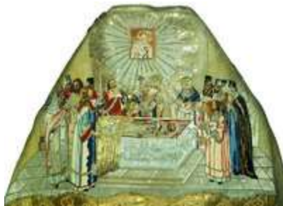
Обретение мощей свт. Димитрия. Оплечье фелони. Кон. XVIII в. (ГМЗРК)

мон-рь и осмотрел мощи, также оказавшиеся нетленными. 27 сент. гроб святителя освидетельствовала комиссия местного духовенства во главе с игум. ярославского в честь Преображения Господня мон-ря Варфоломеем. 30 сент. члены комиссии представили митр. Арсению подробную «опись, в каком качестве явились мощи покойного преосвященного Димитрия, митрополита Ростовского» и акт об их освидетельствовании с подтверждением нетленности. Мощи Д. были переложены в новоустроенный гроб и помещены в каменную гробницу в Троицкой ц. 10 окт. митр. Арсений отправил соответствующее донесение в Синод. Вскоре для нового освидетельствования мощей Д. в Яковлевский мон-рь прибыли Суздальский митр. Сильвестр (Гловацкий) и архим. Чудова мон-ря Гавриил.