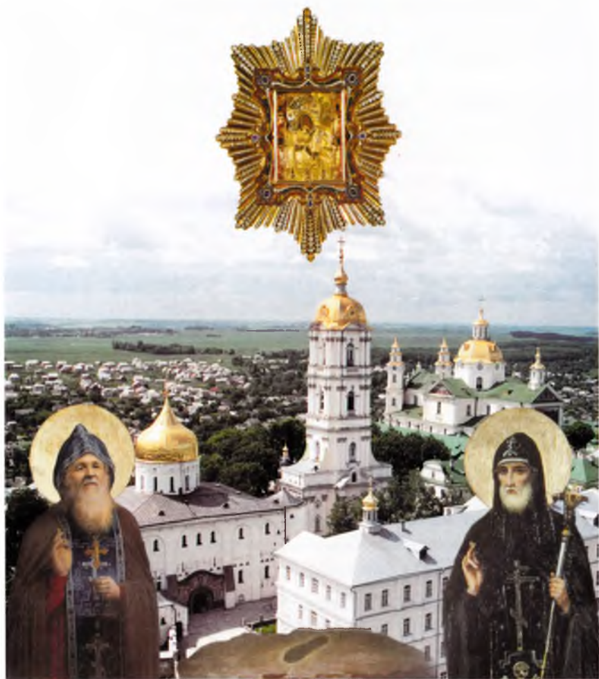
Преподобные Иов и Амфилохий Почаевские