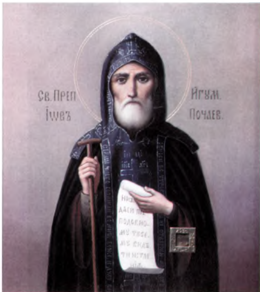
Преподобный Иов Почаевский