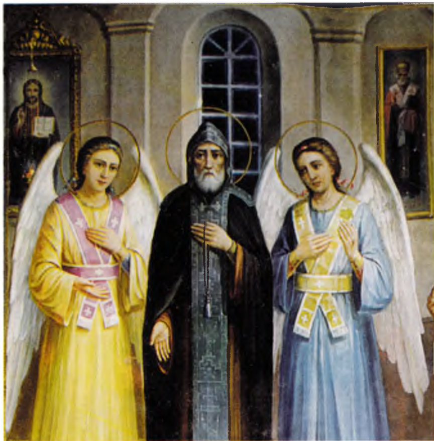
Посмертное явление святого Иова девушке Анне в Свято-Троицком соборе в 1659 году