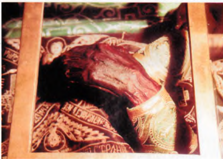
Нетленные мощи преподобного Иова