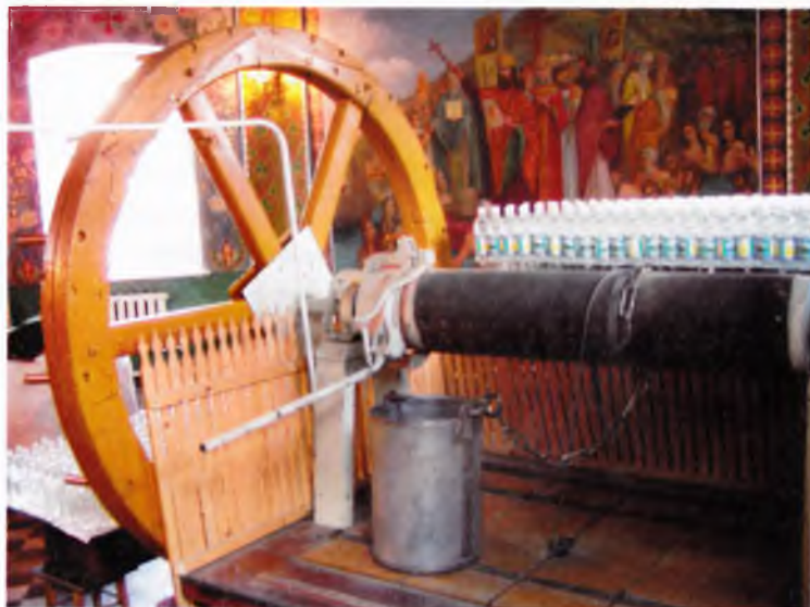
Современный вид колодезя преподобного Иова