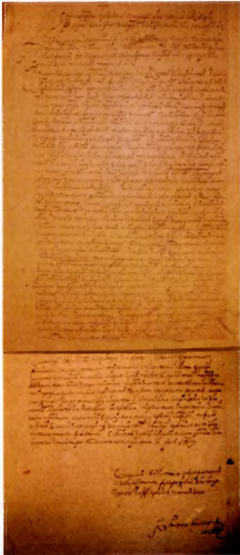
Письмо преподобного Иова к царю Михаилу Федоровичу 1626 год