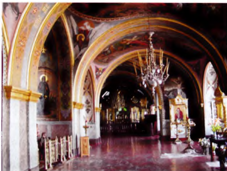
Храм преподобного Иова