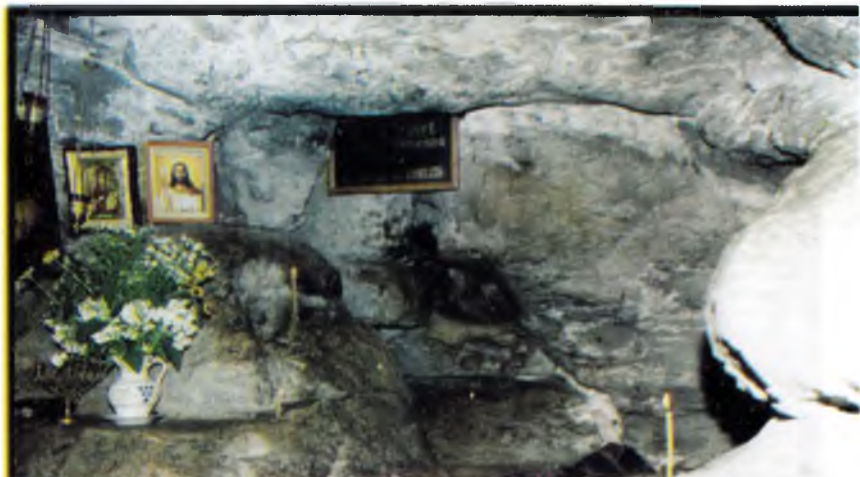
Вход в пещеру преподобного Иова