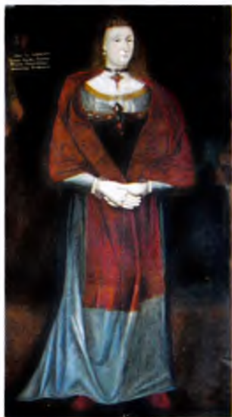
Фундаторка Почаевского монастыря Анна Гойская.