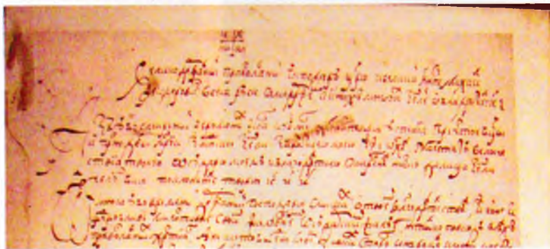
Фрагмент письма преподобного Иова к царю Михаилу Федоровичу