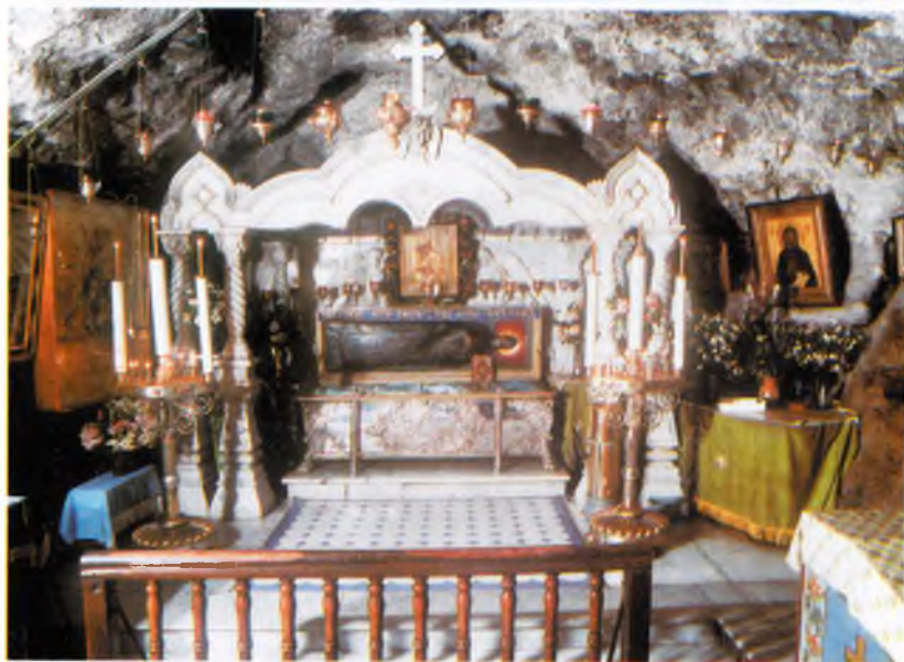
Серебрянная рака с мощами преподобного Иова