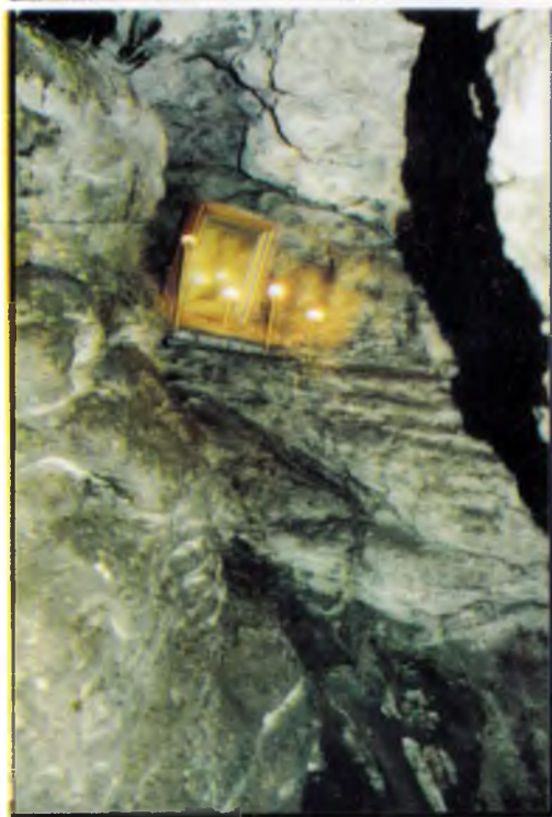
Внутренний вид пещеры преподобного Иова