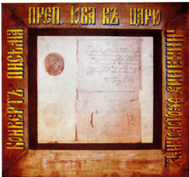
Конверт письма преподобного Иова к царю Михаилу Федоровичу