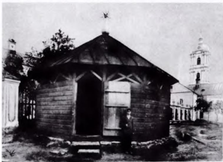
Древний вид колодезя преподобного Иова (фото XIX века)