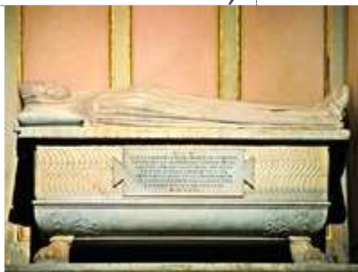
Гробница св. Моники в ц. Сан-Агостино в Риме

Распространение почитания М. было связано с возникновением монашеских орденов, принявших Устав блж. Августина (регулярные каноники, августинцы-эремиты; см. в ст. Августинцы ). Вероятно, к теме почитания святой впервые обратился каноник-августинец Готье († 1193), впосл. ставший аббатом мон-ря Арруэз, к-рый составил Житие М., основанное на «Исповеди» блж. Августина (BHL, N 6000). В 1159 г. Готье посетил Остию и узнал от каноников ц. Сант-Ауреа о гробнице М., которую незадолго до того обнаружили среди руин древнего города и перенесли в храм. Похитив часть мощей, в 1162 г. он доставил их в аббатство Арруэз, где от святыни совершались чудеса. Память перенесения мощей М. отмечалась 20 апр. (BHL, N 6001; см.: Gosse. 1786. P. 93-108).