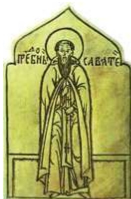
Прп. Савватий Соловецкий. Дробница. 1633 г. (ГММК)

Ранним типом монастырской иконы стал образ «Обитель преподобных Зосимы и Савватия Соловецких», созданный, вероятно, после