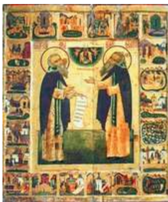
Преподобные Зосима и Савватий Соловецкие, с житием. Икона. Кон. XVI в. (ГРМ)