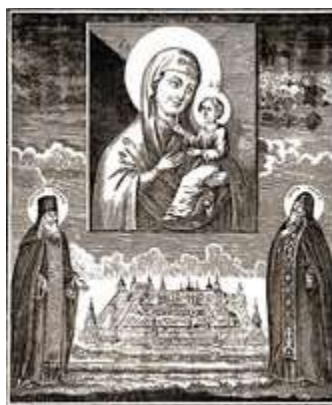
Преподобные Зосима и Савватий перед иконой Божией Матери «Одигитрия». Гравюра. 1849 г. (ГПИБ)