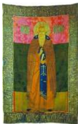
Прп. Зосима Соловецкий. Покров. Кон. 90-х гг. XVI в. Мастерская царицы Ирины Годуновой (ГММК)