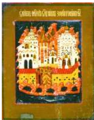
Обитель преподобных Зосимы и Савватия Соловецких. Икона. 1-я пол. XVII в. (ЦАК МДА)

О последних годах жизни З. в Житии рассказывается, что святой пребывал в неустанных молитвенных подвигах; он сделал гроб для себя, поставил его в сенях кельи и каждую ночь плакал над гробом о своей душе. Перед кончиной преподобный призвал к себе братию, завещал им любить друг друга и обещал, что духом будет неотступно пребывать с ними. На игуменство он благословил инока Арсения, заповедав ему хранить церковный устав и монастырские обычаи. Дата