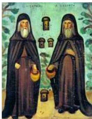
Преподобные Зосима и Савватий Соловецкие. Икона. 2-я пл. XIX в. (ГМИР)