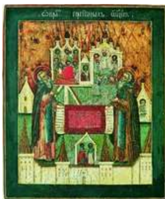
Обитель преподобных Зосимы и Савватия Соловецких. Икона. 2-я треть XVIII в. (частный музей рус. иконы)