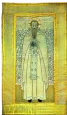
Прп. Савватий Соловецкий. Покров. 1660 г. (ГРМ)

иконописцам поморских вотчин и мастерам крупных художественных центров «чудотворцовы иконы» с изображениями Соловецких преподобных - З., С., Германа, Елеазара Анзерского. Образы писали в обители и закупали целыми партиями в Москве, Костроме, Мстёре, Холуе, Суме (ныне Сумский Посад) и др. Иконография раздаточных икон развивалась на протяжении столетий.