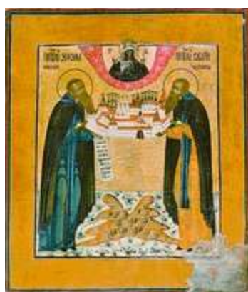
Преподобные Зосима и Савватий Соловецкие, с видом монастыря. Икона. Нач. XIX в. Выг (ЦМиАР)

Следующим этапом канонизации Соловецких преподобных стал Собор, прошедший 1-2 февр. 1547 г. в Москве. На нем было установлено общерус. празднование «новым чудотворцам» З. и С. под 17 апр. (ААЭ. 1836. Т. 1. № 213. С. 203-204). В это время в Соловецком мон-ре по инициативе игум. Филиппа были произведены разыскания святынь, связанных с памятью основателей мон-ря: найдены принадлежавшая С. икона Божией Матери