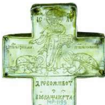
Преподобные Зосима и Савватий, припадающие ко Христу. Крест воздвизальной. 1560/61 г. (ГММК). Фрагмент

В карбасе иноки переправились на Соловецкий о-в и, найдя удобное место в версте от берега, недалеко от горы и возле оз. Долгого, построили 2 кельи (в сев. части острова на губе Сосновой; в посл. на месте их поселения возник скит, названный Савватиевским). Согласно «летописцу соловецкому» нач. XVIII в., иноки прибыли на Соловки в 6937 (1428/29) г. (В памятниках выговской книжной традиции (в Выголексинском летописце, в «Историях об отцах и