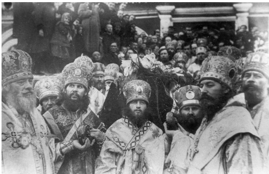
Донски манастир 1925 год. Изношење тела свѧтѧтѣшег патријарха Тихона после опѣла. С лева на десно, у првом плану: архієп. Борис (Соколов), епископи: Атанасіје (Сахаров), Августин (Беѡајев), Иларион (Беѡски), Јосаф (Удалов) и Амвросіје (Поѡански).

Къ пѧмѧть вѣчнѡю [вѡдетъ прѣвникъ, ѿ сѡухѧ слѧ не оѹбоѡтсѧ].*47