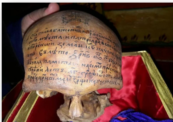
Мошти св. Пајсија у Пећкој Патријаршији