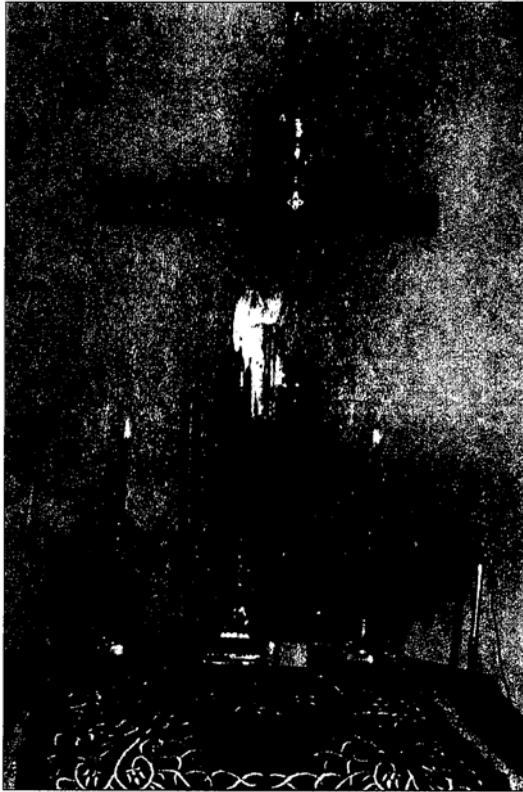
‘Η Αγία Τράπεζα τοῦ παρεκκλησίου τοῦ ἁγίου Ἀλκιβιάδου εἰς Περαίαν Θεσσαλονίκης