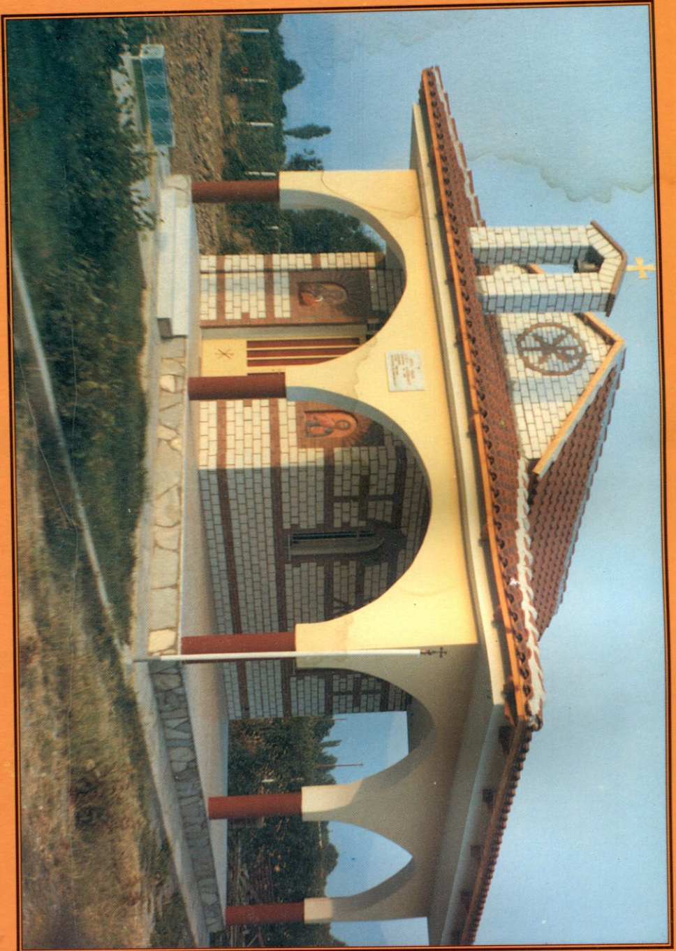
Ο ιδιοκτήτης Τερός Νάος του Αγίου Αλκιμάδου της οικογενείας Ιακώβου Σαββοπούλου εις Πεγαίαν Θεσσαλονίκης και του ἀειμνήστου Ἀγκυβιάδου Τεβέρη