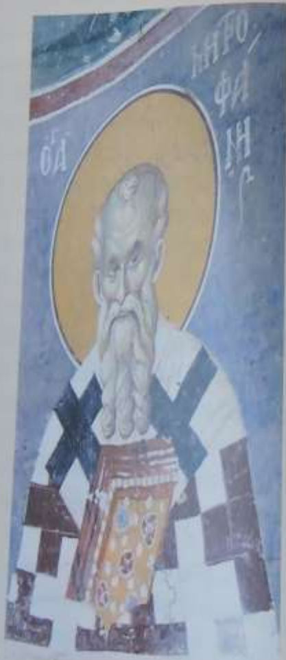
Ὁ Ἅγιος Μιτροφάνης Ἀρχιεπίσκοπος Κωνσταντινουπόλεως. Τεταγογραφία στὸ Staro Nagornino, Σερβία.