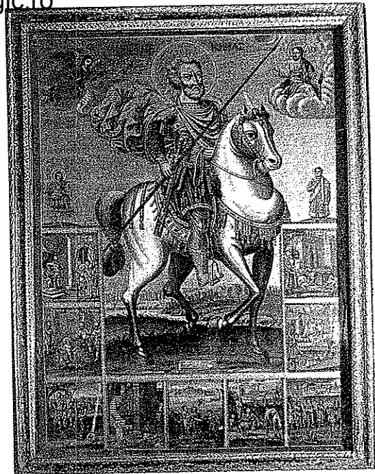
Φορητή εικόνα από τόν Ἱ. Ναό Εισοδίων τῆς Θ. Κ. Βασιλιάδος Καστοριάς.