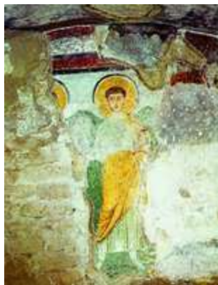
Св. Ианнуарий на фоне Везувия и Соммы. Роспись катакомб св. Ианнуария в Неаполе. X-XI вв. (?)