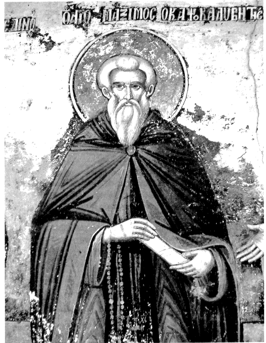
Τοιχογραφία στόν βόρειο ἐξωτερικό τοῖχο τοῦ Πρωτάτου. α' μισό 18ου αἰ. Ἔργο Κωνσταντίνου καί Ἀθανασίου ἐκ Κορυτσᾶς (ἀπόδοση).

Ὁμότιμος Καθηγητής τῆς Παιδαγωγικῆς τῆς Φιλοσοφικῆς Σχολῆς τοῦ Πανεπιστημίου Ἀθηνῶν. Πρόεδρος τοῦ Φιλολογικοῦ Συλλόγου Παρνασσός.