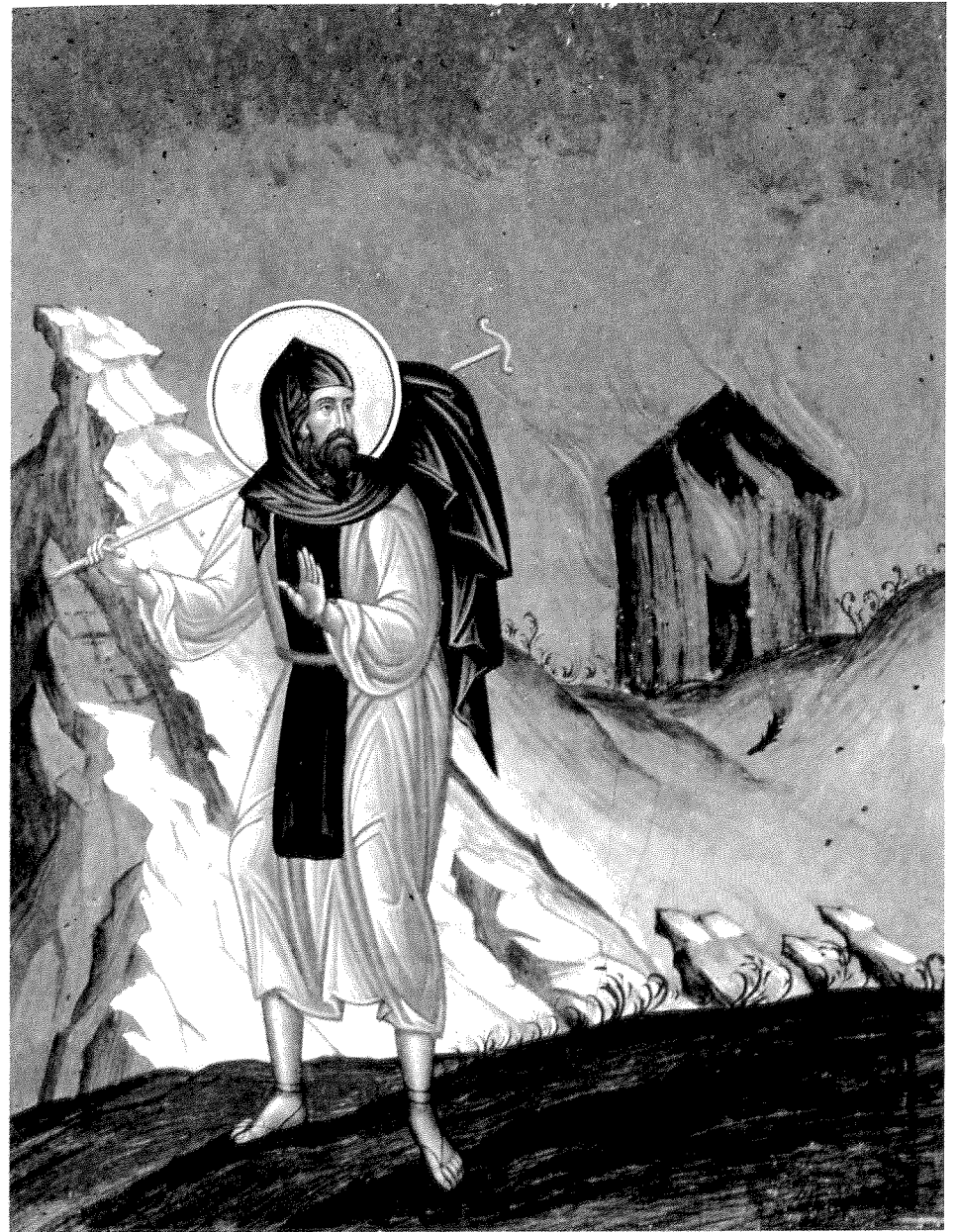
Ὁ ἅγιος Μάξιμος ὁ Καυσοκαλύβης. Σύγχρονη φορητὴ εἰκόνα στό παρεκκλήσι τῆς Κοιμήσεως Θεοτόκου τῆς Καλύβης τοῦ Ἁγ. Ἀκακίου Καυσοκαλυβίων. Ἔργο Παταπίου μοναχοῦ Καυσοκαλυβίτου.