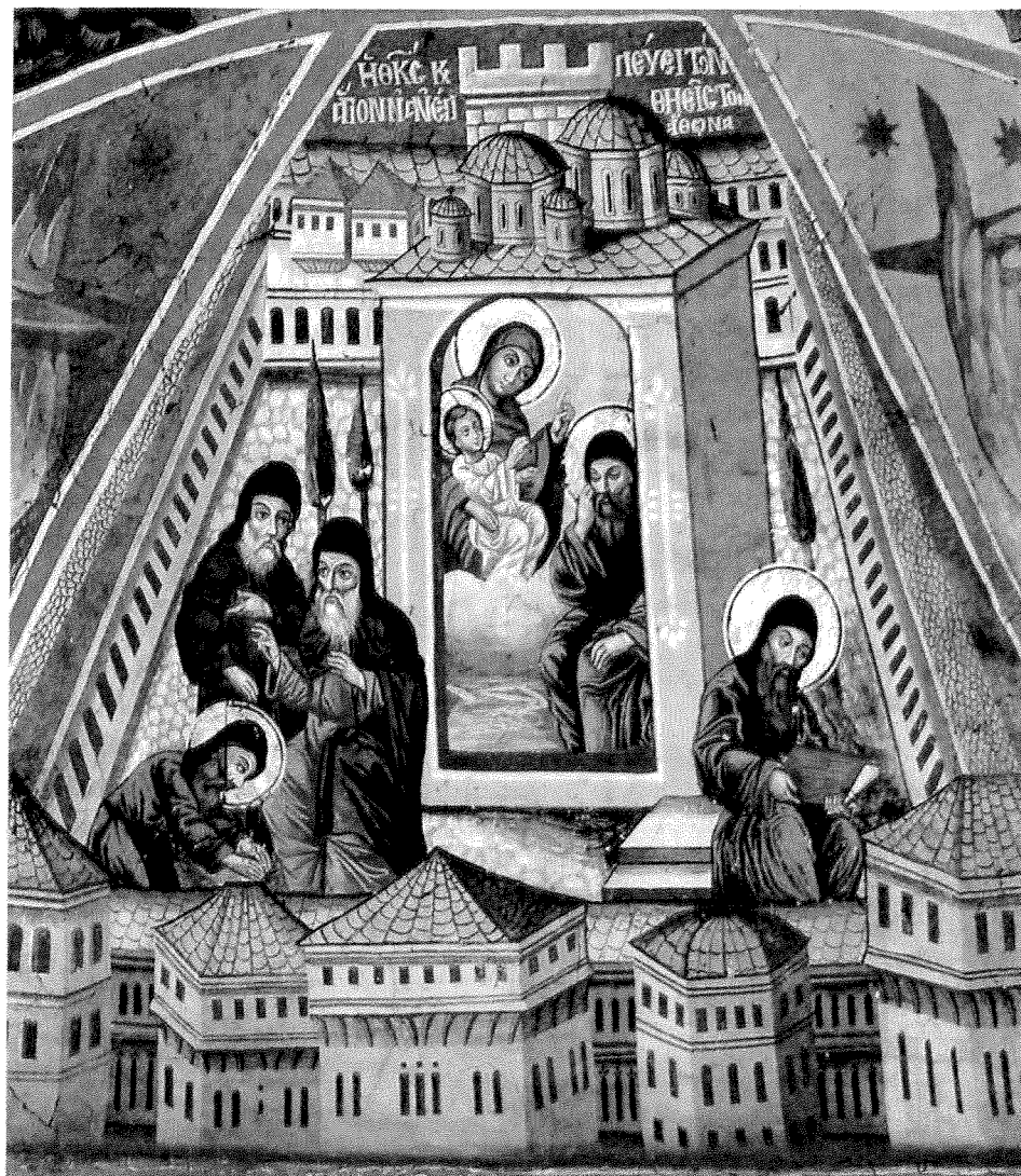
«Ἡ Θεοτόκος κελεύει τόν ἅγιον ν' ἀνέλθῃ εἰς τόν Ἄθωνα». Τοιχογραφία Λιτῆς Κυριακοῦ Καυσοκαλυβίων (λεπτομέρεια). 1820. Ἔργο Μητροφάνη μοναχοῦ ἐκ Βιζύης.