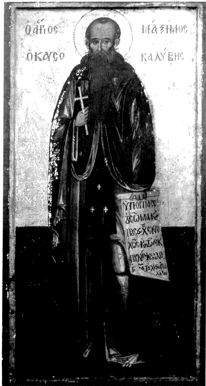
Ο άγιος Μάξιμος ο Κουσοκαλύβης. Φορητή εικόνα α' μισού 18ου αί. Καλύβη Αγ. Μαξίμου. Κουσοκαλύβια.

Τὸ βασανιστικὸν ἔργον ἐκτελέσας ἐπέστρεψεν εἰς τὴν πατρίδα καὶ ἐπέμεινε ἐν τῇ Κουσοκαλύβῃ ἕως τοῦ θανάτου αὐτοῦ.