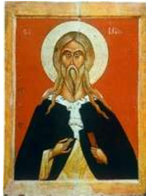
Прор. Илия. Икона. Сер.- 2-я пол. XV в. (ГТГ)

верхней части креста И. изображен с развернутой хартией. По сторонам - сюжеты с сарептской вдовой: справа она протягивает И. сосуд, слева - склонилась перед пророком в молении о сыне.