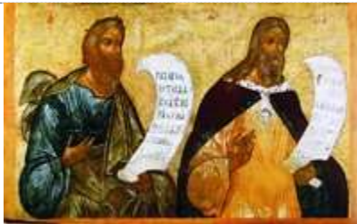
Пророки Илия и Варух. Икона. 30-е гг. XVI в. (?) (КБМЗ)

написана Захарием Цановым для ц. св. Афанасия (1856, Региональный исторический музей, Варна) - четверку лошадей ведет под уздцы ангел, И. сидит в плетеной карете, с него падает милоть, напоминающая шубу. На фоне картуша выделено пространство для нек-рых житийных композиций, в нижней части иконы - сюжеты жертвоприношения на горе Кармил. Вторая икона происходит из церкви с. Водица, она близка по замыслу к первой, но более простого исполнения (XIX в., Региональный исторический музей, Варна). Иногда И. изображается, как, напр., на болг. иконе 1-й пол. XVIII в. из митрополичьей ц. Успения Пресв. Богородицы в г. Самокове, в пещере, сидящим на красной подушке, положенной на золоченую скамью, а перед ним столик с изысканной посудой (Болгарская живопись XI-XIX вв.: Кат. выставки. М., 1976).