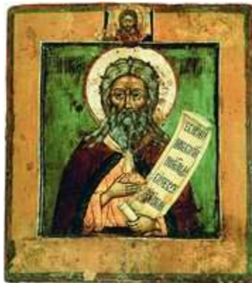
Прор. Илия. Икона. 1-я четв. XVIII в. (Троицкий мон-рь в Муроме) (МИХМ)

каноны Богородице и И. В Мессинском Типиконе 1131 г. (Arranz. Turicon. P. 168-169), представляющем южноитал. редакцию Студийского устава , память И. отмечается более торжественно: на вечерне совершается вход , читаются 3 паремии И. (первая - 3 Цар 17. 1-24; вторая - 3 Цар 18. 1, 17-46; 19. 1-16; третья - 3 Цар 19. 19-21; 4 Цар 2. 1, 6-14); на утрени исполняются 3 антифона (Пс 96, 111, 98), седален И., поются степенны , прокимен из Пс 104, «Всякое дыхание» , читается Евангелие - Мф 23. 23-[28], поются 2 канона И., великое славословие ; указания для литургии те же, что и в Студийско-Алексиевском Типиконе, за исключением прокимна, к-рый в данном случае берется из Пс 63.