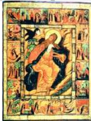
Прор. Илия в пустыне, с житием. Икона. 1682 г. (ЦАК МДА)

( Greg. Nazianz. Or. 21. 7 ). Для Тертуллиана И.- пример мученика за веру в Др. Израиле, пророка можно сравнить с мучениками первых веков христианства ( Tertull. Adv. gnost. 8. 3 ). Подвижническая жизнь И. (ограничения в пище и одежде, а также его внешний вид (4 Цар 1. 8)) рассматривается как прообраз жизни монахов и отшельников. Афраат Персидский в соч. « Demonstrationes », посвященном «сынам завета», к-рые брали на себя обязательства, близкие к монашеским, многократно ссылается на И. ( Aphr. Demonstr. VI 2 : «Тот, кто возлюбил девство, пусть станет подобен Илии»). Свт. Афанасий в Жизнеописании прп. Антония Великого ( Athanas. Alex. Vita Antonii. 7 ) указывает на то, что Антоний следовал примеру И. и в его судьбе видел отражение своей жизни.