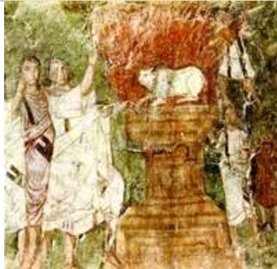
Жертвоприношение прор. Илии. Роспись

Изображения И. были так же распространены, как и образы свт. Николая Чудотворца, великомучеников Георгия Победоносца и Димитрия Солунского. В иконографии И. соединены символические элементы, отражающие его значение как соучастника важнейших событий в истории божественного домостроительства. Слова свт. Иоанна Златоуста содержат яркую образную характеристику И.: «Представим... Илию, пророка, земного ангела и небесного человека, ходившего по земле и управлявшего небесной колесницей, бывшим ростом в три локтя и достигавшего до великой высоты, поднявшегося до самых сводов небесных, повелителя вод, которого язык был хранилищем вод и ключом небес» ( Иоанн Златоуст, свт. Слово об ап. Петре и прор. Илии // Творения. 2004. Т. 2. Кн. 2. С. 776 ).