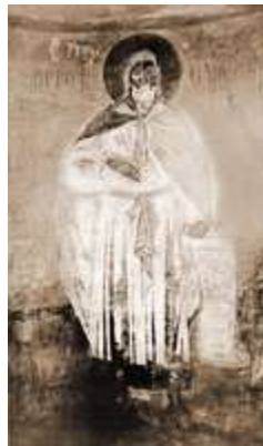
Прор. Илия. Роспись ц. Успения Пресв. Богородицы на Волотовом поле в Вел. Новгороде. 80-е гг. XIV в.

В поствизант. искусстве сохранились основные иконографические варианты И., унаследованные от Византии. Поясное изображение пророка в апостольских одеждах