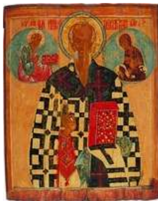
Сщмч. Власий. Икона. 2-я пол. XV в. Муром (ЦМиАР)

В основе парного изображения В. и свт. Спиридона, еп. Тримифунтского, в рус. иконах также лежит народное представление об их покровительстве домашнему скоту, опирающееся на эпизоды житий. На иконе (нач. XV в., ГИМ) из ц. Власия в Вел. Новгороде (построена в 1407) святители восседают напротив друг друга на фоне скалистых гор, у ног В.- коровы и козы, возле Спиридона - овцы, козы, свиньи. Подобным образом они изображены в нижнем ярусе 3-рядной иконы сев. письма (кон. XV - нач. XVI в., ГРМ) «Чудо архангела Михаила о Флоре и Лавре. Святители Власий и Спиридон».