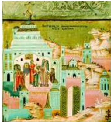
Епископская хиротония свт. Евфимия II. Фрагмент

раз в 4 года в течение месяца вершить в Новгороде апелляционный суд. В пользу этого предположения свидетельствует грамота митр. св. Фотия Тверскому еп. Илии , относящаяся, вероятно, к 8 авг. 1430 г. (РИБ. Т. 6. № 50. Стб. 421-423; о датировке грамоты см.: Голубинский . История РЦ. Т. 2. Ч. 1. С. 394; Янин В. Л. Из истории новгородско-московских отношений в XV в. // он же . Средневековый Новгород: Очерки археологии и истории. М., 2004. С. 298-299). Митр. Фотий, разрешая Тверскому архиерею поставлять священников в соседние области Новгородской епархии, объяснял отсутствие в Новгороде архиерея тем, что новгородцы не подчинились митрополиту в вопросе о суде последнего в Новгороде («тое старины церковные не отравили»). Лишь 26 мая 1434 г. Е. был хиротонисан митр. Герасимом в Смоленске (согласно Житию прп. Михаила Клопского, святой предсказал Е. поставление на кафедру митр. Герасимом; см.: Повесть о житии Михаила Клопского // БДР. 1999. Т. 7. С. 226, 228).