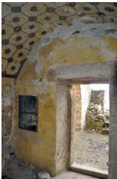
Село Брестовик, Гроцка – гробница светих мученика Ермила и Стратоника (унутра).