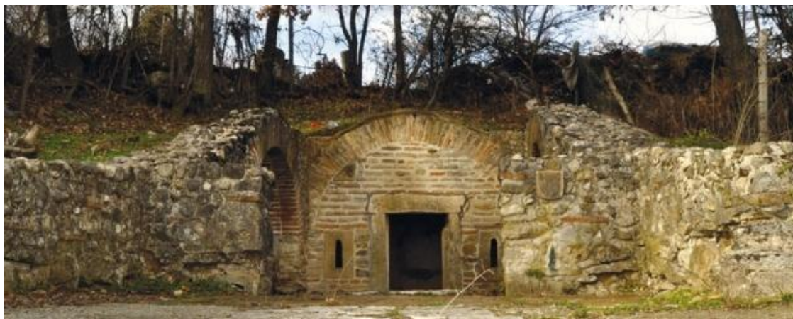
Село Брестовик, Гроцка – гробница светих мученика Ермила и Стратоника (споља).