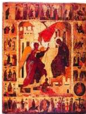
Благовещение с Акафистом. Икона из местного ряда

Назарете, в числе др. 8 чистых израильских дев была избрана для изготовления пряжи для новой завесы храма. По жребию Ей выпало прясть пурпур. За этой работой и застал Деву Марию арх. Гавриил, посланный принести благую весть о рождении Спасителя мира. Прежде чем предстать перед Богородицей в доме, архангел, будучи невидимым, обращается к Ней, когда Она отправилась за водой к источнику, поэтому Б. у колодезя называется предблаговещением. Б. у источника входит как один из эпизодов в цикл иллюстраций «Протоевангелия Иакова» (напр., росписи собора Св. Софии в Киеве, 1037-1045; собора Сан-Марко в Венеции, после 1200; ц. Богородицы Перивлепты в Охриде (Македония), 1295; собора мон-ря Хора (Кахрие-джами) в К-поле, 1316-1321; Тихвинская икона Божией Матери с протоевангельским циклом - XV в., НГОМЗ), а также в иллюстрации Акафиста Богоматери, первые 4 сцены к-рого представляют Б. (напр., икона «Похвала Богоматери с Акафистом» из Успенского собора Московского Кремля, XIV в.).