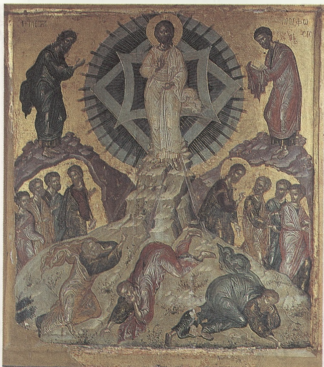
Ἡ Μεταμόρφωσις τοῦ Σωτήρος Χριστοῦ 16ος αἰών, Χεῖρ Θεοφάνους τοῦ Κρητός.